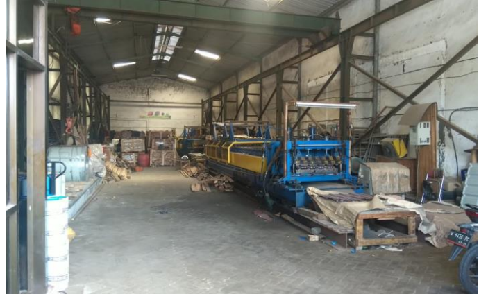
CV AGUNG JAYA JL. MARGOMULYO PERMAI BLOK G NO. 29