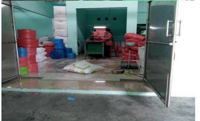
PERORANGAN FABIANI PLASTIK JL. LEBAK TIMUR ASRI I NO. 126