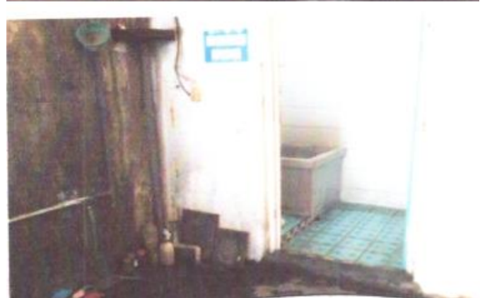
ANUGRAH INTI MAKMUR JL. MARGOMULYO INDAH NO. 18