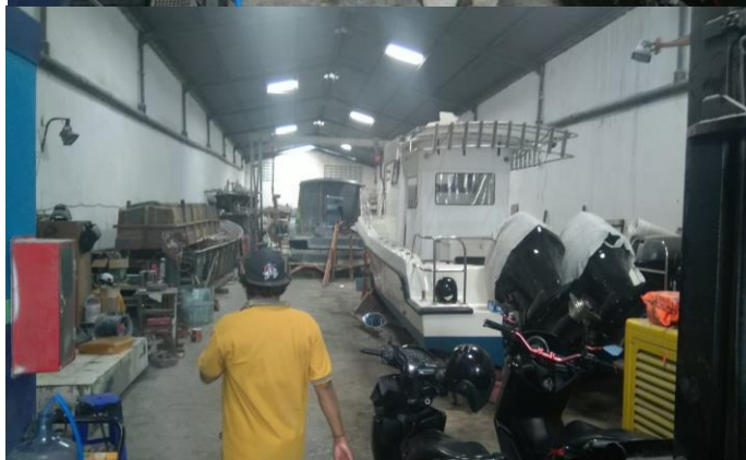
PT SAMUDRA SINAR ABADI SHIPYARD JL. MARGOMULYO PERMAI BLOK F/19