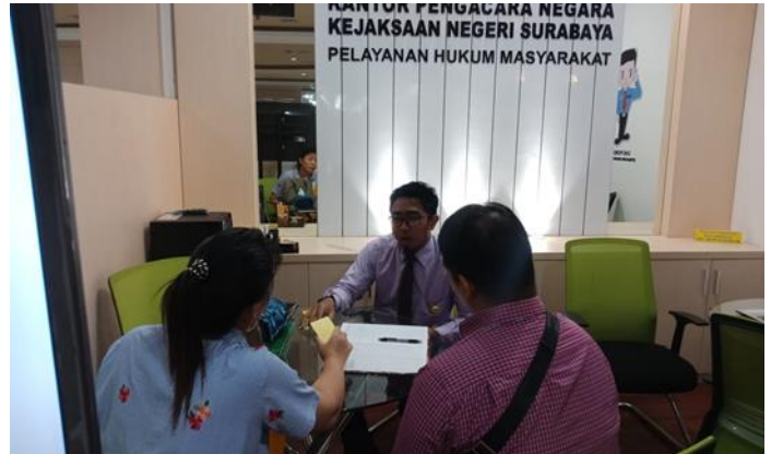
Pelayanan Kejaksaan Negeri Surabaya