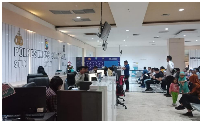
Pelayanan Kepolisian Resort Kota Besar Surabaya