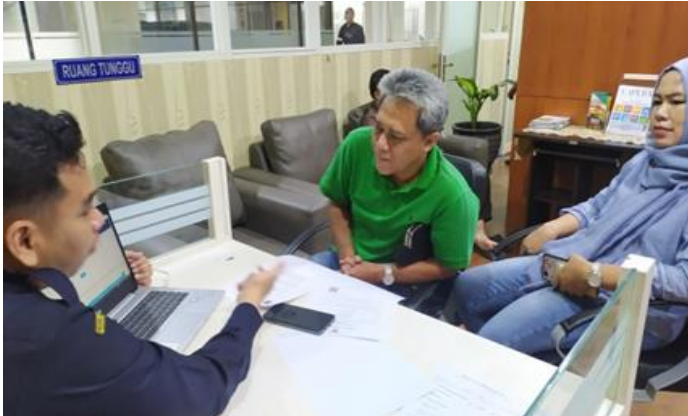
PT Alam Jangkar Samudera