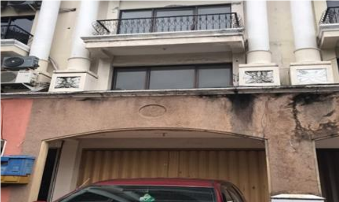
PT Bukit Adiwana Jl. Mayjen HR. Mohammad No.147 (PMDN) Perusahaan Tidak Ada Dilokasi Usaha