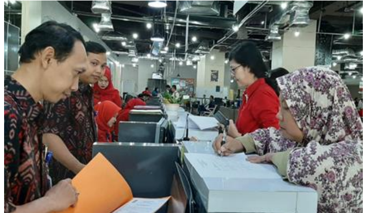
Pelayanan Loker Pengambilan