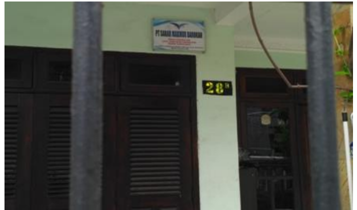
PT SABAR MAKMUR BAROKAH Jl. Bendul Merisi Gang Besar Timur 28-B