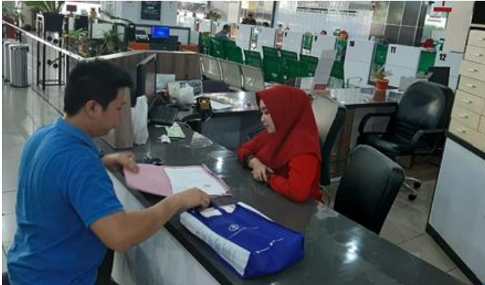
Pelayanan Loker Informasi