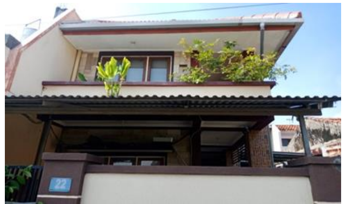
Jl. Gembili II No. 22