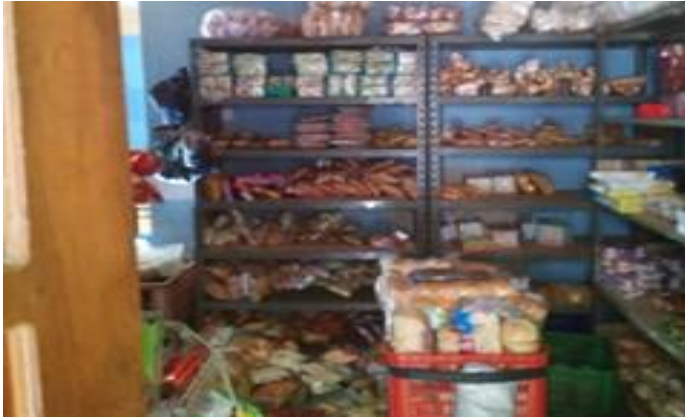
Toko Sumber Hasil Makmur Jl. Simo Pomahan Gang 6A No. 18 Surabaya