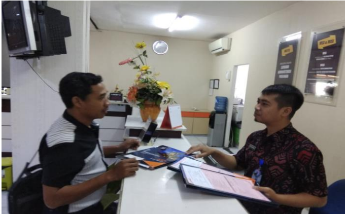
Pelayanan Customer Service