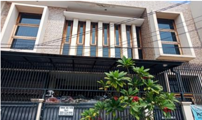
Jl. Ubi V No. 5