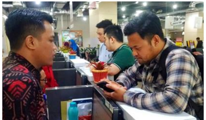
Pelayanan Loker Pengaduan