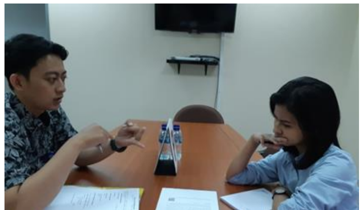
PT Aktif Indonesia Indah Jl. Rungkut Industri III No. 64 (PMDN)