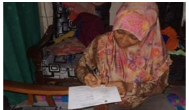
NNR Jl. Simorejo Timur 2 No. 53 B Surabaya