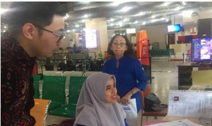
Pelayanan Loker Mandiri