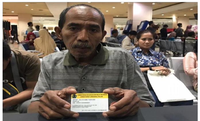
Pelayanan Kanwil Dirjen Pajak Jatim 1