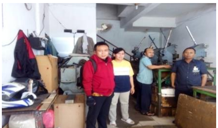
PERUSAHAAN PERORANGAN NUSANTARA ELECTRONIC BOX Jl. Arief Rachman Hakim 51-D 2 (lama : RUKO KLAMPIS 21 Blok D-2)