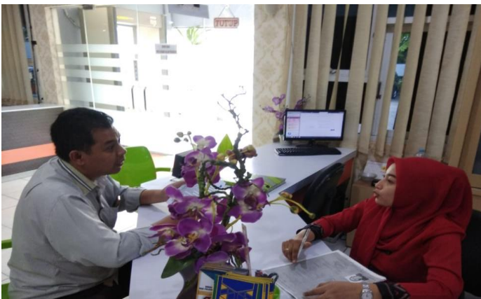
Pelayanan Loker Informasi