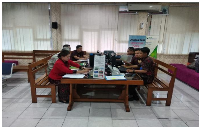
Pelayanan Loker Mandiri