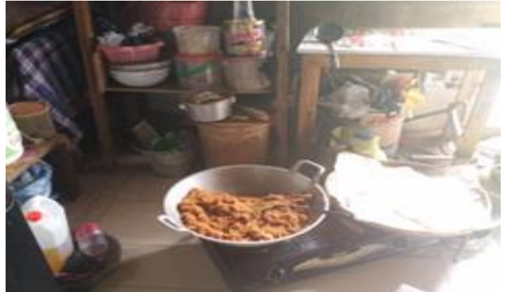
Sroendeng Soerabaja Jl. Simo Jawar No. 1 Surabaya