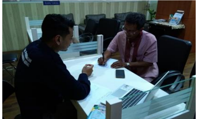
CV Berlian Niagari

Jumlah PMA dan PMDN yang diberikan asistensi sebanyak 2 perusahaan