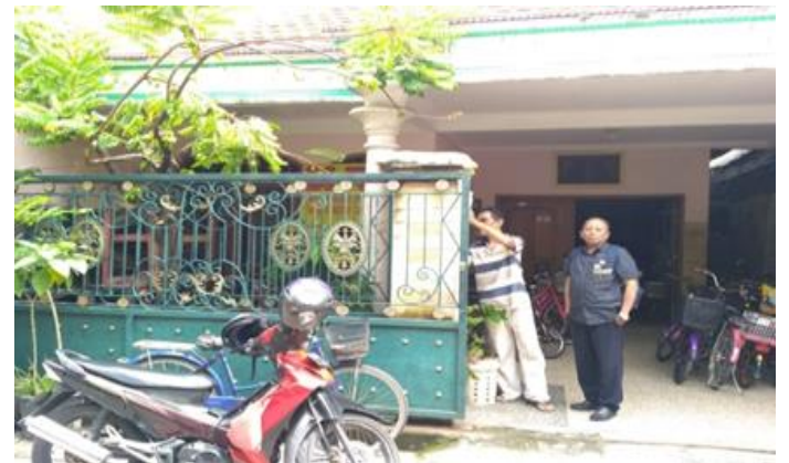
CV KALIMAS MULTI SARANA Jl. Jagir Sidoresmo VI No. 62