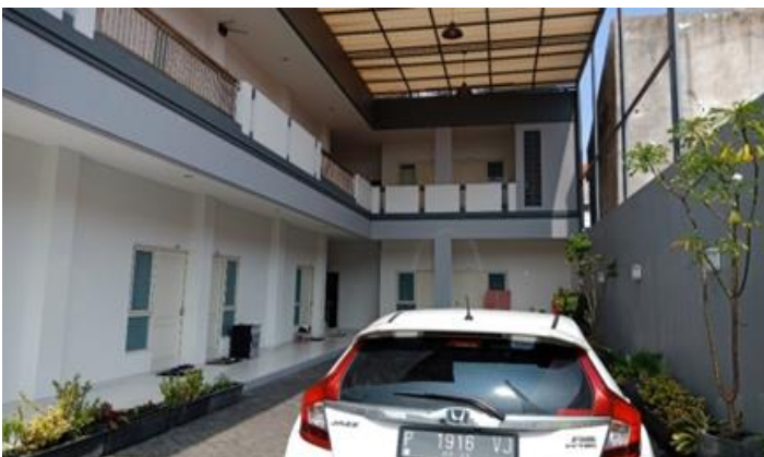
Jl. Gembili No. 6