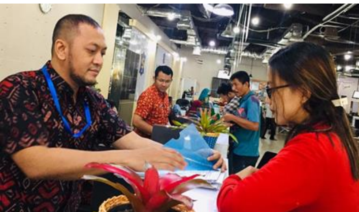
Pelayanan Loker Customer Services