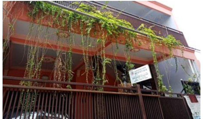
Jl. Karangrejo Sawah II No. 15