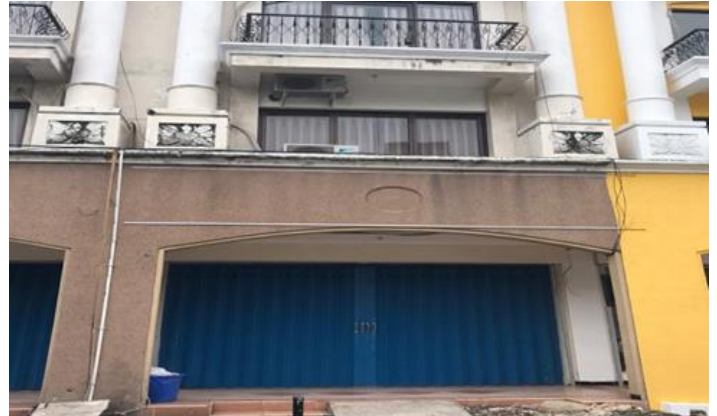
PT Rimba Cendana Jl. Mayjen HR. Muhammad No.147 (PMDN) Lokasi Tidak Ada Usaha Kosong

Jumlah Pengawasan/Survey PMA dan PMDN sebanyak 6 perusahaan