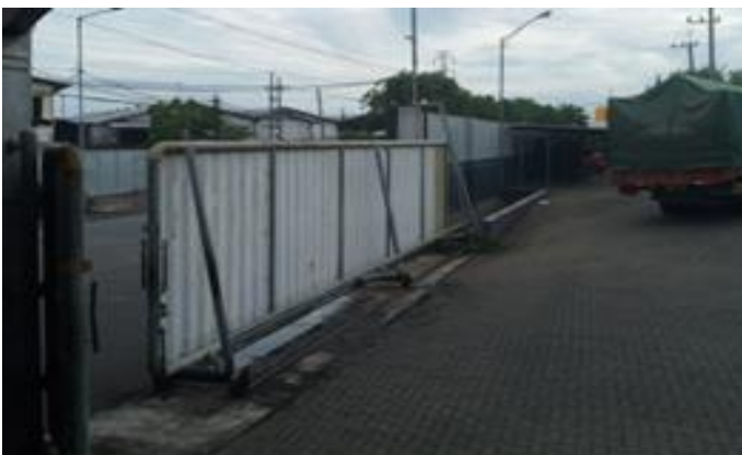
CV Gunung Sewu Hasil Lancar Abadi Jl. Simorejo Sari B No. 7 Surabaya