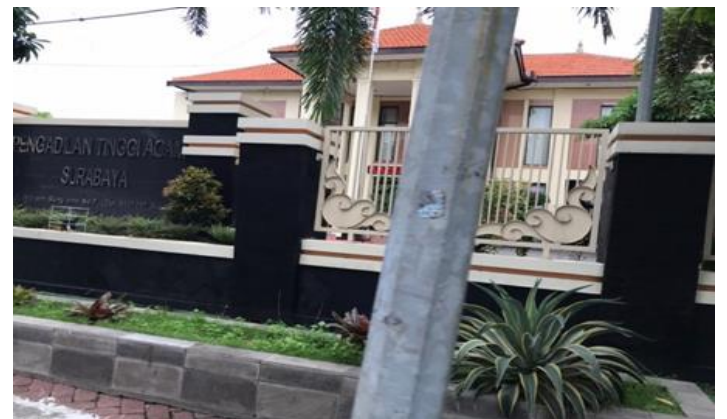
PT Maria Indah Indonesia Jl. Mayjen Sungkono 7 (PMA) Perusahaan Tidak Ada Dilokasi Usaha