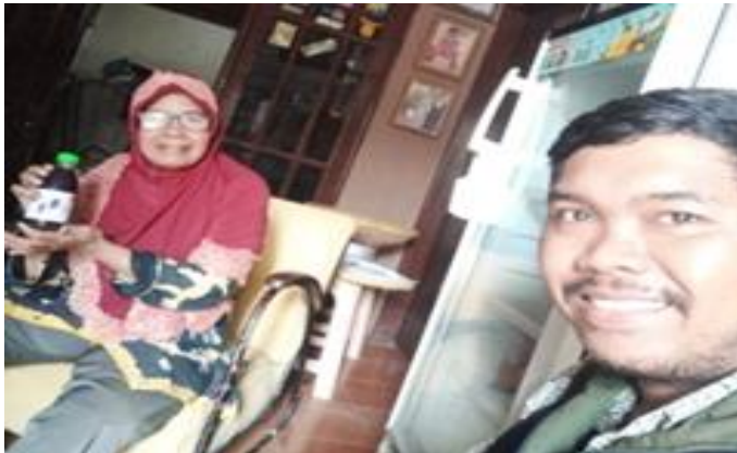
Tjap Simo Jl. Simo Mulyo Baru 7H No. 15 Surabaya