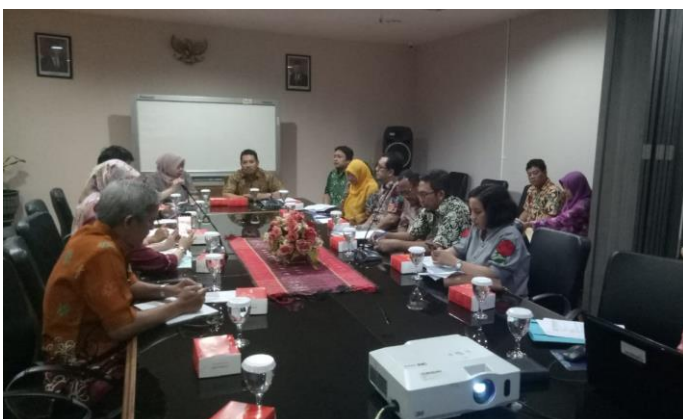
Penerimaan Tamu Sekretariat Jenderal DPR RI