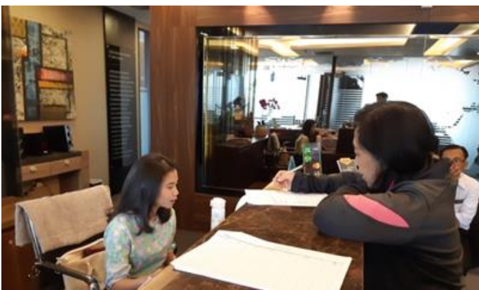
PT Rembaka Jl. Rungkut Industri IV No. 25-27 (PMDN)