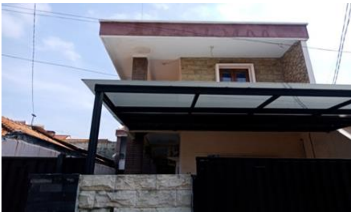
Jl. Gembili II No. 47