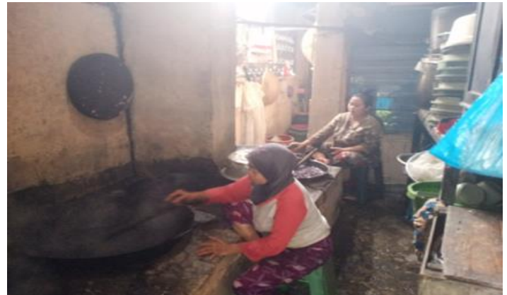
Madumongso Echo Jl. Simo Mulyo Baru 5C No. 1 Surabaya