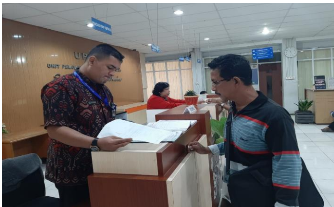
Pelayanan Loker Pencabutan Berkas