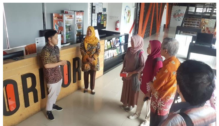
Kunjungan ke Co-Working Space