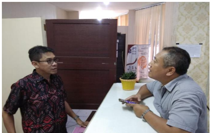
Pelayanan Konsultasi Sertifikat Laik Fungsi

Jumlah Permohonan Perizinan Yang Masuk Sebanyak 156 Berkas