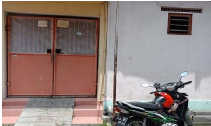
Jl. Jetis Kulon IB No. 26 Blok B 20