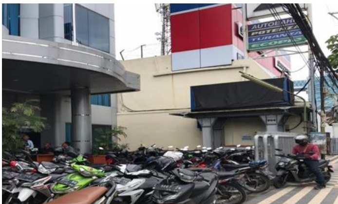
PT Galaxi Indah Nusantara Jl. Mayjen Sungkono No. 204 (PMA) Perusahaan Tidak Ada Dilokasi Usaha