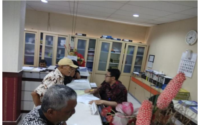
Pelayanan Loker Pengambilan